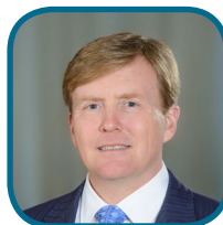
E: ..... .....