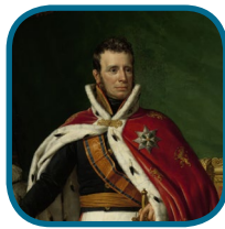
A: Willem I