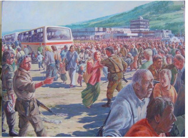
Srebrenica, 11 juli 1995