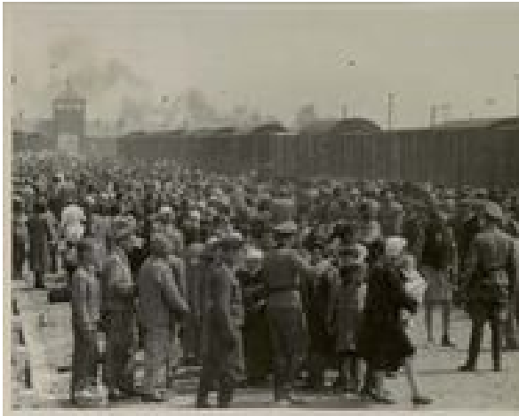
Auschwitz, mei/juni 1944